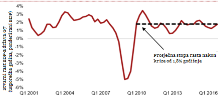
Sl. 1.: U zadnje vrijeme zabilježen je postupni porast ekonomske aktivnosti u G7